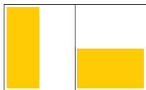
93 x 232 1/2 188 x 114