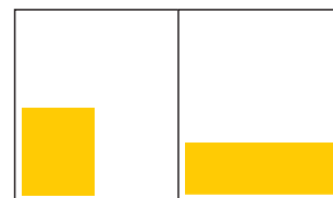
93x114 1/4 188 x 55