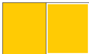
210 x 270 1/1 188 x 232 (+ spád 3-5 mm)