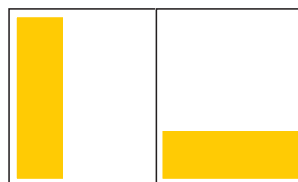
62 x 232 1/3 188 x 74